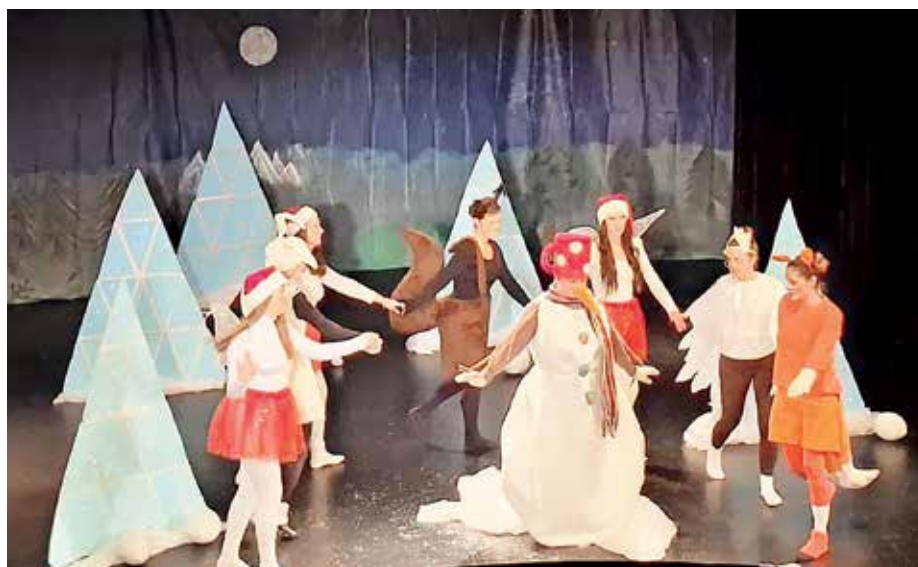
Vzgojiteljice so najmlajše razveselile s predstavo Sneženi mož in božične vile.

Dogajanje ob prehodu starega v novo leto pa so zaznamovala še novoletna rajanja po skupinah, igre na snegu, obisk Dedka Mraza, ogled jaslic v žirovski cerkvi in plesne urice.