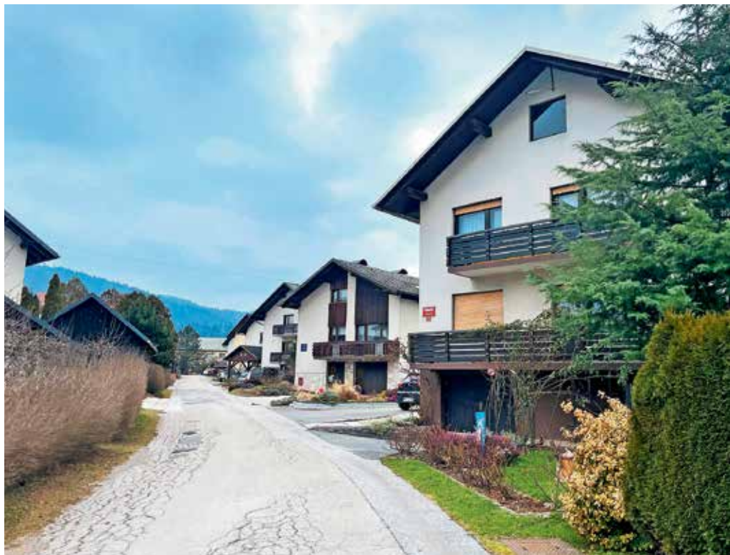
Obnovo vodovodnega omrežja bodo začeli v Prvomajski ulici.