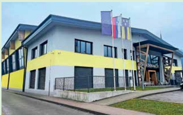
Sončno elektrarno bodo postavili tudi na strehi športne dvorane.

Občina Žiri se je pod okriljem Lokalne energetske agencije Gorenjske uspešno prijavila na javni razpis za sofinanciranje izgradnje novih naprav za proizvodnjo električne energije iz sončne energije na javnih stavbah in parkiriščih. Sončni elektrarni bodo postavili na strehi športne dvorane in čistilne naprave. Na razpisu, na katerega so se prijavili skupaj s še šestnajstimi partnerji, so za projekt pridobili 157 tisoč evrov nepovratnih sredstev. Občina tako namerava še letos izvesti gradnjo sončnih elektrarn. Kot so pojasnili ob prijavi na razpis, je projekt usmerjen v izboljšanje energetske učinkovitosti in spodbujanje uporabe obnovljivih virov energije, hkrati pa zagotavlja prispevek k zdravemu in trajnostno naravnemu okolju. Računajo, da bodo pri stroških za omrežnino in električno energijo na leto prihranili trideset tisoč evrov.