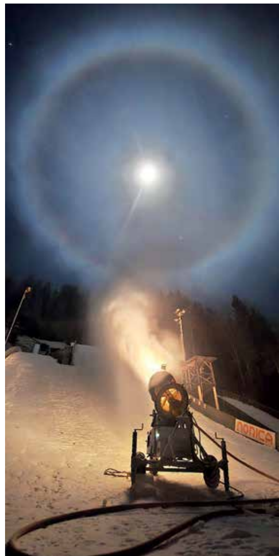
Zasneževanje ob polni luni

Decembra nam je vreme namenilo nizke temperature, kar pomeni, da smo lahko skakalnice oblekli v snežno odejo, tako da treningi potekajo nemoteno. V tem času smo organizirali tudi nekaj tekmovanj. V januarju smo bili med drugim organizatorji gorenjskega šolskega prvenstva, na katerem je sodelovalo kar sto otrok od prvega do četrtega razreda. Zelo smo bili veseli, da je bila na tekmovanju skoraj polovica