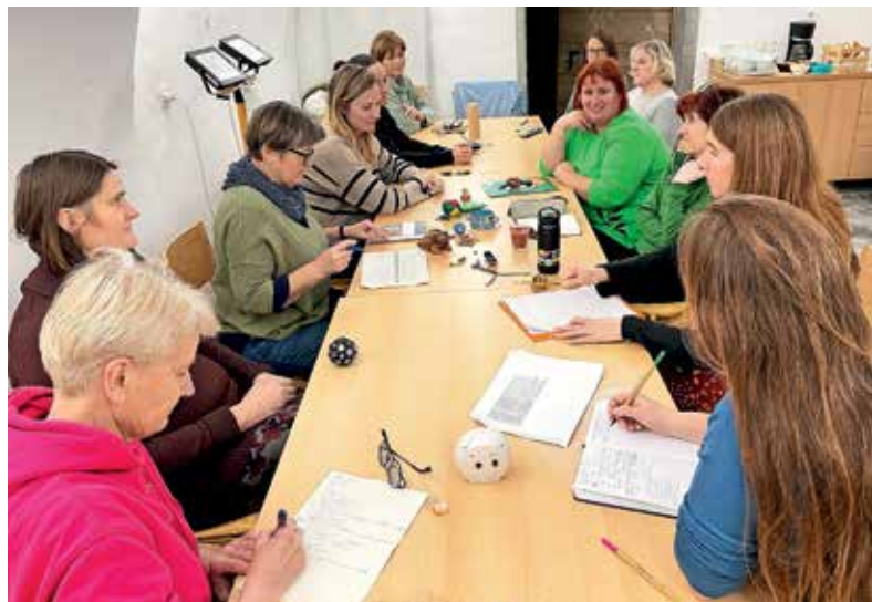
V Krajevni knjižnici Žiri vsako sredo potekajo srečanja v okviru medgeneracijskega projekta branja in pripovedovanja Vezi pripovedk.