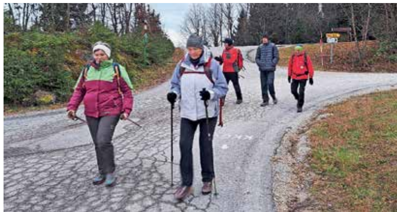
Člani društva ŠmaR so se lani na zadnje romanje odpravili k svetemu Andreju na Planini nad Horjulom.

In mi, romarji, ga vedno znova dokazujemo. Zguljeni čevlji, preznojena telesa in nasmeh na obrazu so dokaz. Delimo nasmehe,