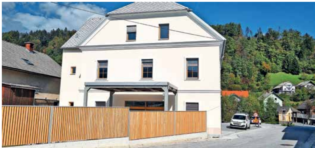
Hiša generacij v Gorenji vasi

V pritličju Hiše generacij poteka dnevno varstvo za največ šest uporabnikov, ki lahko nekaj ur dnevno preživijo v družbi