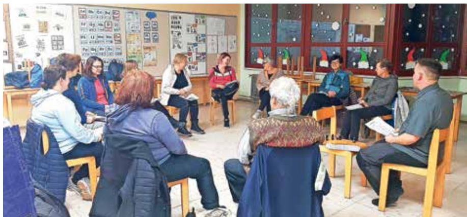
Letos si želijo za vseživljenjsko izobraževanje navdušiti še več ljudi.

V Žireh je veliko zanimanja za izobraževanja o različnih ročnih spretnostih. Lani so se izvedle delavnice izdelovanja makrame nakita in voščilnic ter delavnice kvačkaranja, kaligrafije in polstenja. Več srečanj je bilo izvedenih na temo ljudskega zdravilstva in zelišč, na temo nege in oskrbe starejših na domu, izobraževali so se na področju demence, v okviru študijskega krožka pa spoznavali krasilno umetnost in