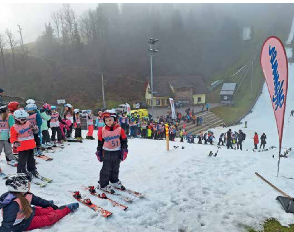
Utrinek z gorenjskega šolskega prvenstva

otrok iz Osnovne šole Žiri in Osnovne šole Poljane. To kaže, da so smučarski skoki zelo priljubljen šport v Žireh in Poljanski dolini, hkrati pa, da se nam za podmladek ni treba bati. To je tudi promocija kluba, ki je s pomočjo prostovoljcev iz vrst staršev in podpornikov kluba pripravil odlično tekmo.