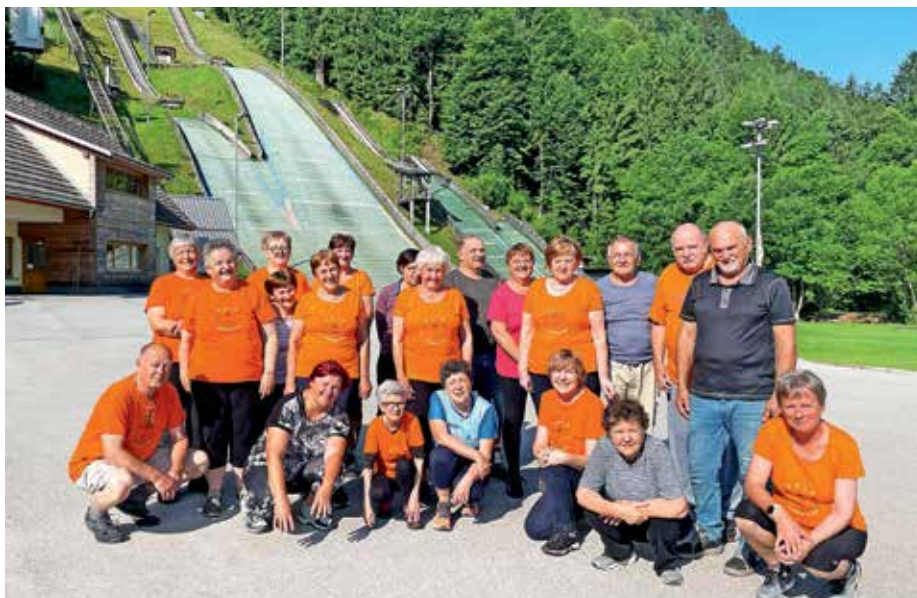
Vadeči pod skakalnico

Tudi v Žireh uspešno deluje Šola zdravja, nastala je celo himna vadbi, poimenovani 1000 gibov.