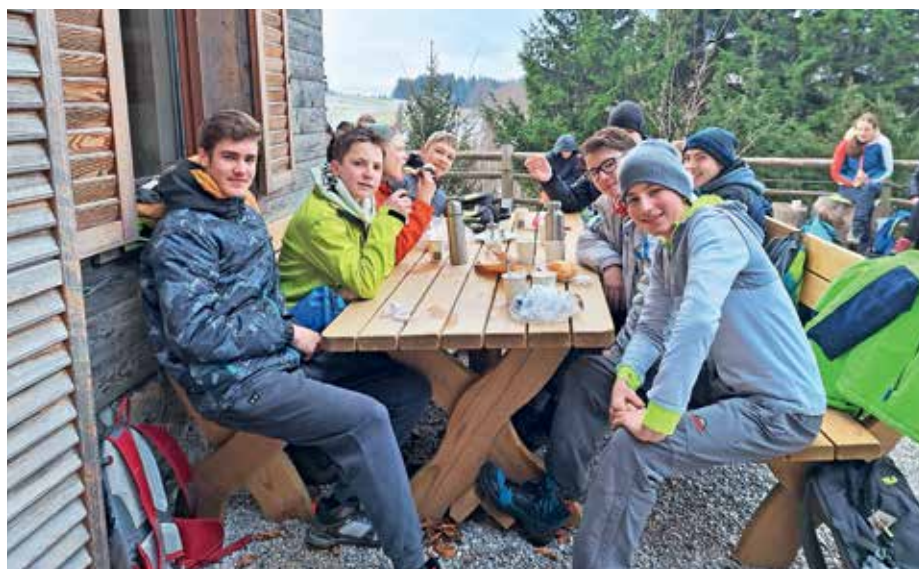
Počitek učencev planinskega krožka pri koči na Mrzlem vrhu

Letos je prvič potekalo šolsko tekmovanje iz znanja slovenščine za Vodnikovo priznanje, tokrat poskusno za osmošol-