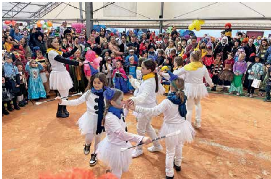
Utrinek z lanskega pustnega rajanja za otroke